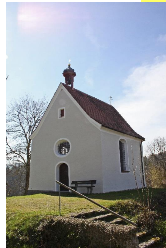
Kapelle St. Michael auf Niedergundelfingen